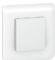
767 23 с суппортом и рамкой Mosaic