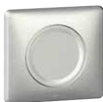
674 08 (Титан)