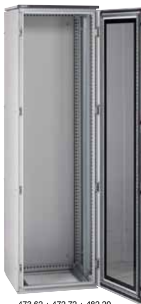
473 62 + 472 72 + 482 20