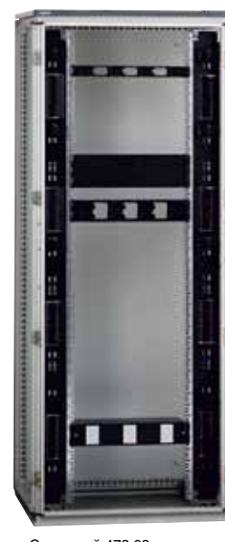
С дверцей 473 63