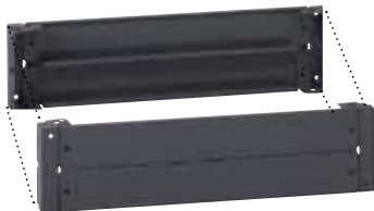
Комплект цоколя Кат. № 464 52, состоящий из 4 угловых блоков с глухими передней и задней панелями