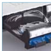
Оптическая кассета Кат. № 335 20