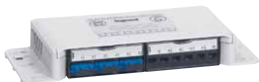
Кат. № 335 40 с вставкой адаптеров типа SC с оптической кассетой арт. № 335 20 и блоком из 6 соединителей RJ 45