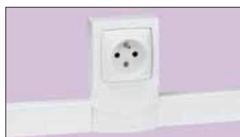
Рамка на 1 пост «специальная для DLP», Кат. № 314 04, с розеткой 2К+3 Кат. № 861 27