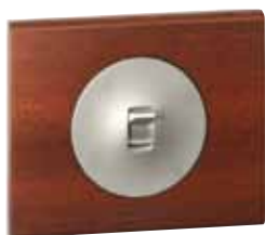
670 16 (Орех)

механизмы управления освещением: переключатели, датчики движения светорегуляторы