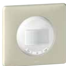
670 91 (Светло-бежевый)

Таблица выбора лицевых панелей (стр. 515-516) Таблица выбора рамок и суппортов (стр. 522-525)