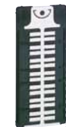
385 27 + 385 03