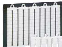
385 30 + 395 02