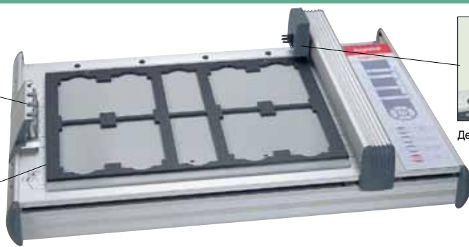
Плоскопечатный плоттер кат. № 385 40 и аксессуары