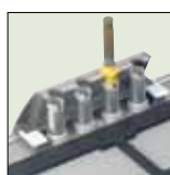
Магазин для фломастеров

для маркировочных элементов Метосаб, Duplix и наклеек для клеммных блоков, устройств управления и сигнализации