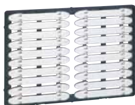
385 32 + 385 09