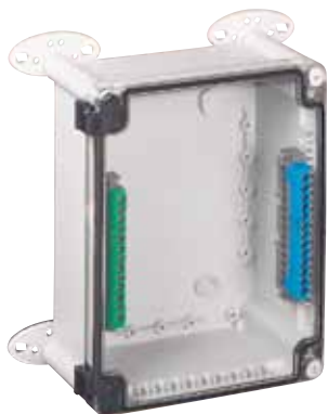
359 61 с кронштейнами Кат. № 358 02 и IP2х клемниками