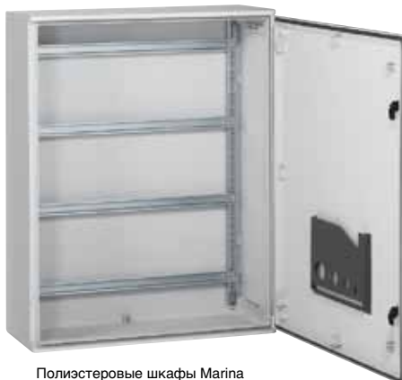
Полиэстеровые шкафы Marina