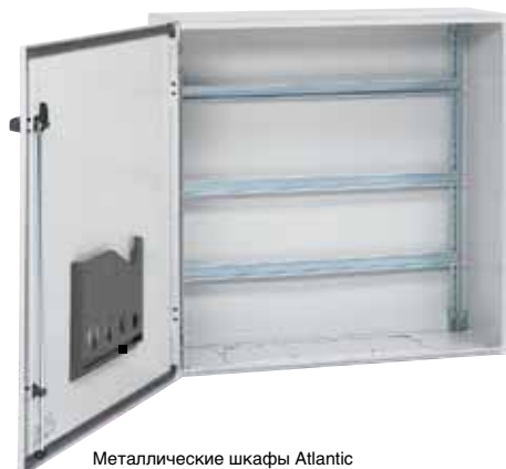
Металлические шкафы Atlantic