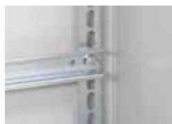
367 84 с клипсо-гайками 364 42 + винты 367 75