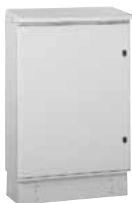
362 63 + цоколь 362 92 + крыша 362 95