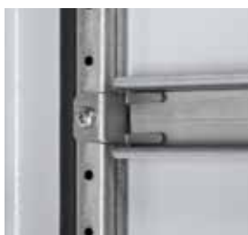
477 18 + 477 16 Профильный уголок жесткости двери