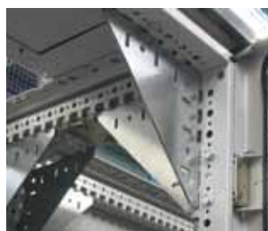
473 41 Комплект элементов жесткости для антисейсмического исполнения