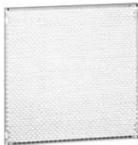
Монтажные платы малого размера Lina 12,5 Кат. № 481 43, Lina 25 Кат. № 474 96

Для сборных или моноблочных шкафов Altis. Промежуточные платы только для сборных шкафов В сборных шкафах устанавливаются непосредственно на каркас сзади шкафа или на боковую поверхность В моноблочных шкафах устанавливаются с помощью профильных стоек или многофункциональных траверсов