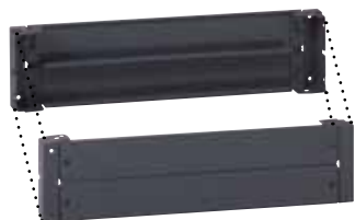
Кат. № 476 67 состоит из 4 углов и пластин для монтажа спереди и сзади