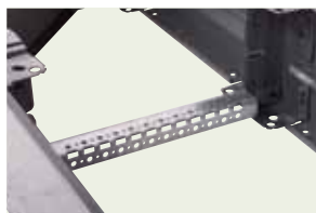
476 92 с сетчатым кабелепроводом