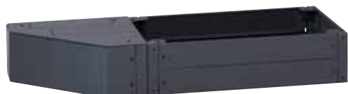
Комплект 476 67 с вентиляционной пластиной 476 63 и приспособлением для сопряжения 477 05