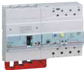
252 56 + 260 36