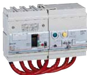
250 45 + 260 13