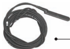
Capteur de température extérieure

Maintient un confort égal avec la plus grande précision qui soit.